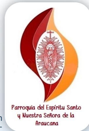
Parroquia del Espíritu Santo y Nuestra Señora de la Araucana

C/Puerto Rico, 29. 28016 Madrid. Teléfono 914 579 965