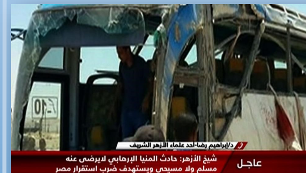
عاجل مسلم ولا مسيحي ويستهدف ضرب استقرار مصر شيخ الأزهر: حادث المنيا الإرهابي لا يرضى عنه